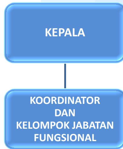
Gambar 1 Bagan Struktur Organisasi Loka POM di Kabupaten Jember

Pada Loka POM di Kabupaten Jember, Koordinator dan Kelompok Jabatan Fungsional bertanggung jawab langsung kepada Kepala Loka POM di Kabupaten Jember. Kelompok jabatan fungsional melakukan tugas dan fungsi sebagaimana tercantum dalam Keputusan Kepala Badan POM RI nomor HK.02.02.1.2.05.20.158 Tahun 2020 tentang Tata Hubungan Kerja dan Pola Koordinasi Pengawasan Obat dan Makanan di Lingkungan Badan POM, sebagaimana berikut: