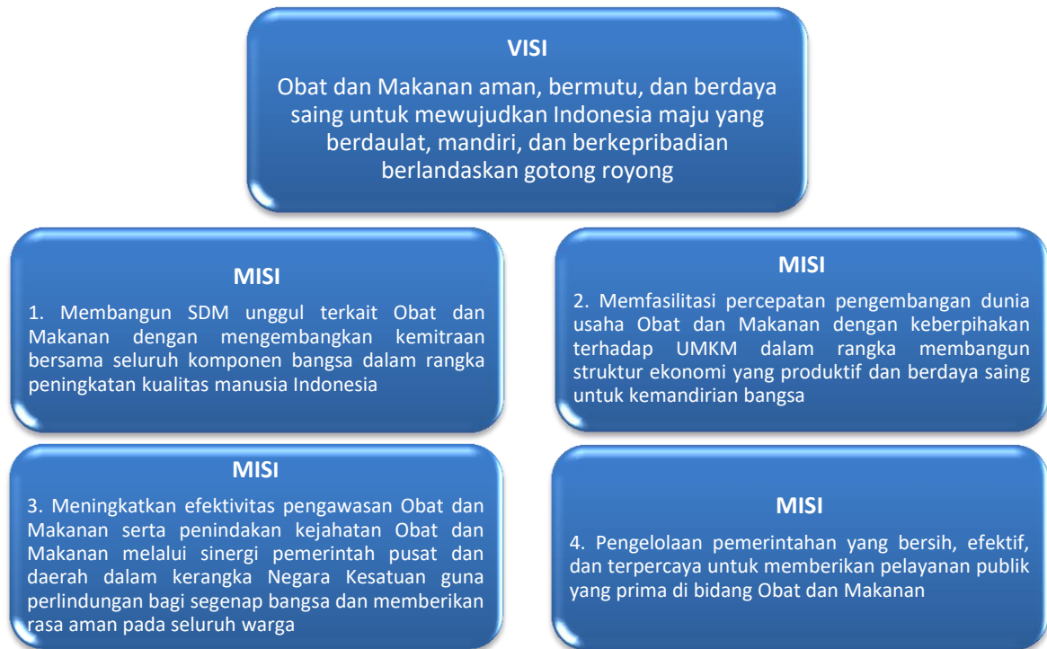
Gambar 4 Visi dan Misi

Sejalan dengan visi dan misi pembangunan dalam RPJMN 2020-2024, maka Badan POM telah menetapkan visi dan misi sebagai berikut: